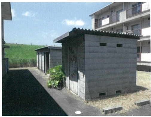
倉庫1 (プロパン庫: 手前) 倉庫2 (奥)